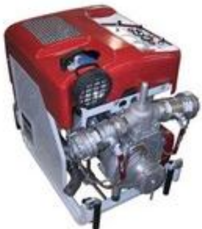
Přenosná motorová stříkačka PFPN 10-1000 KOMFI