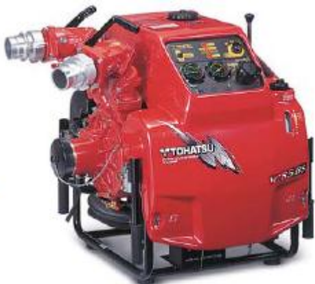
Přenosná motorová stříkačka Tohatsu VC85BS