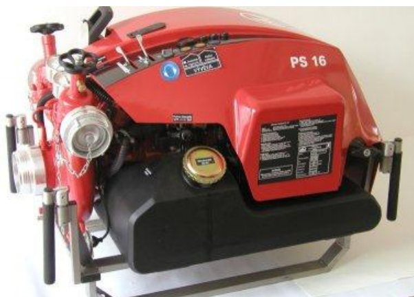
Přenosná stříkačka PFPN 10-1500