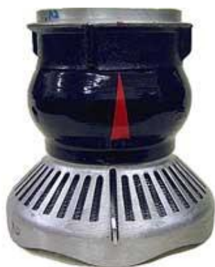
Sací koš Profi I