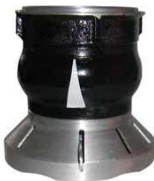
Sací koš Profi II