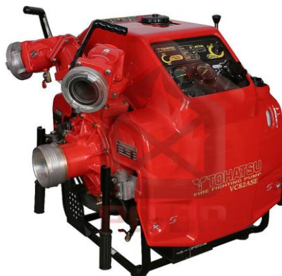
TOHATSU VC82ASE - přenosná motorová stříkačka - kulové uzávěry