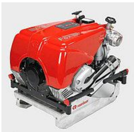
Přenosná motorová stříkačka Rosenbauer FOX III